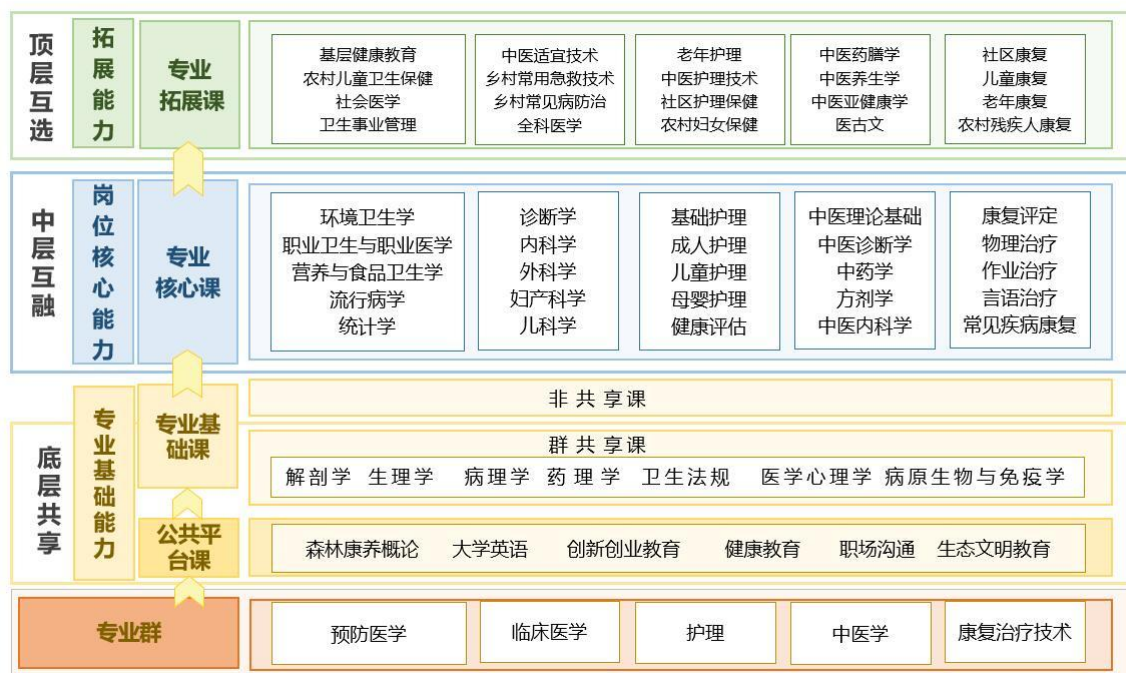
图1 专业群课程体系图

健康服务业以医疗护理为依托，以康复疗养为手段，以预防保健为目的，通过医护人员在不同工作领域中“护疗康防”的全程服务，使患者恢复健康，并持续促进健康、保障健康。专业群以专业岗位核心能力和健康服务新业态、新标准（规范）、新产品、新设备为重点，重构并优化“专业基础平台+岗位核心能力+拓展能力”的专业群模块化课程体系（见图1），积极开发特色拓展课程模块，以适应基层健康服务新业态的需求。